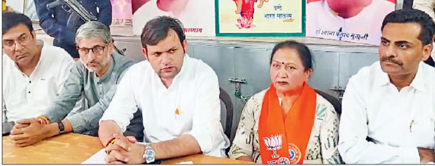
सिरसा। पत्रकारों से बातचीत करते खेल राज्यमंत्री गौरव गौतम।

राज्यमंत्री गौरव गौतम ने कहा कि प्रधानमंत्री नरेंद्र मोदी ने युवाओं के सामने यह विजन रखा है कि 2047 तक, जब भारत आजादी के 100 वर्ष पूरे करेगा, तब देश को आत्मनिर्भर और विकसित बनाया