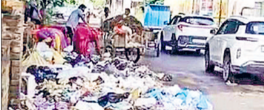
फतेहाबाद। टेलीफोन एक्सचेंज के सामने लगा कूड़े का ढेर।

महारा स्वच्छ सुथरा फतेहाबाद का नारा देने वाली नगर परिषद द्वारा शहरभर में कचरा संग्रहण केंद्र ऐसे ऐसे जगहों पर बना रखे हैं, जो शहर की सुंदरता को लुंठ तो चिढ़ाते ही हैं, आने जाने वाले लोगों की नाक में भी दम कर रखते हैं। बस स्टैंड के सामने और बीएसएनएल एएसएचजे के सामने तो बुरा हाल बना रहता है। इसी समस्या से परेशान बीएसएनएल के फतेहाबाद सहायक महाप्रबंधक ने नय प्रशासन को पत्र लिखकर बीएसएनएल कार्यालय के सामने कचरा डंपिंग प्लांट को स्थानांतरित करने की मांग की।