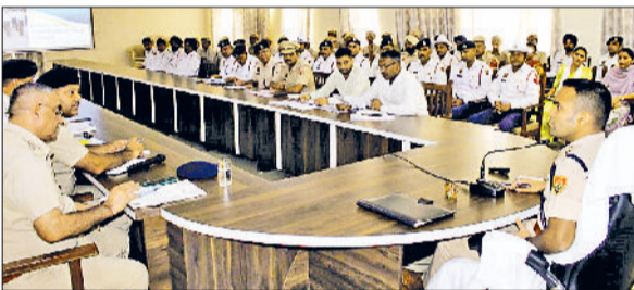
फतेहाबाद। समीक्षा बैठक में अधिकारियों को निर्देश देते एसपी सिद्धांत जैन।

जिले में यातायात व्यवस्था को और अधिक सुचारु व सुरक्षित बनाने के उद्देश्य से पुलिस अधीक्षक सिद्धांत जैन के मार्गदर्शन में पुलिस लाइन स्थित एनजीओ मेस सभागार में समीक्षा बैठक आयोजित की गई। इस बैठक में जिलेभर से यातायात पुलिस अधिकारी एवं कर्मचारी उपस्थित रहे। बैठक के दौरान वर्तमान ट्रैफिक व्यवस्था, मौजूदा चुनौतियां तथा संभावित सुधारों पर विस्तार से चर्चा की गई। बैठक में डीएसपी ट्रैफिक कुलवंत सिंह, फतेहाबाद यातायात प्रभारी